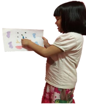
幼儿一边指图片，一边说“眼睛”。