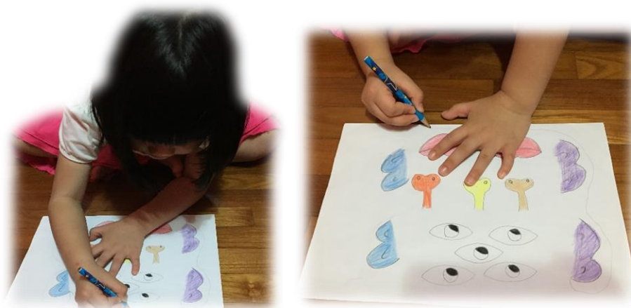
幼儿画出大怪物的脸。