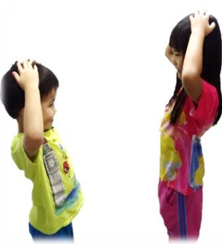
幼儿进行“请你跟我这样做”的游戏。