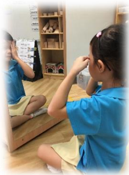
幼儿一边照镜子，一边说出“眼睛”。